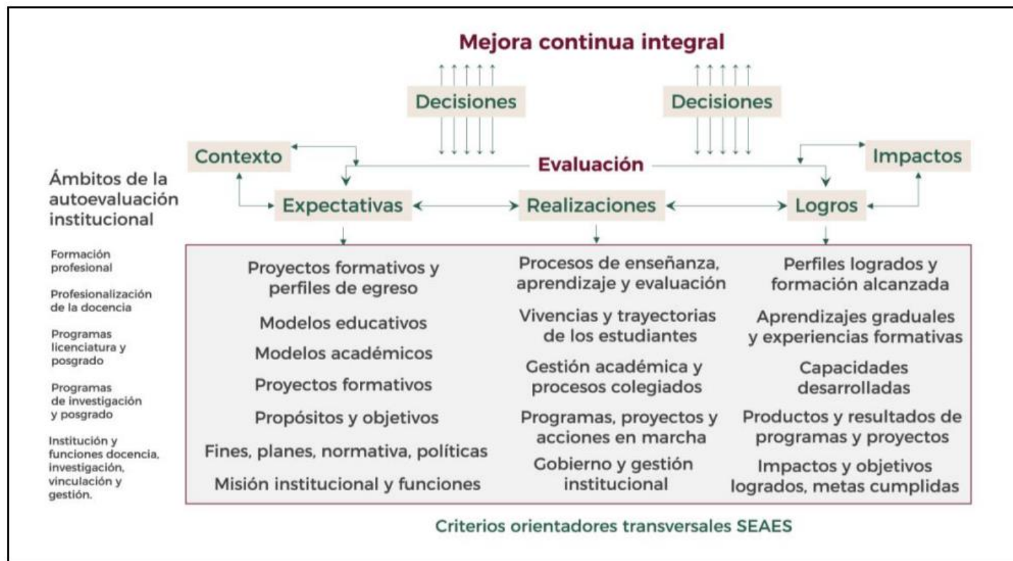
Figura 2. Evaluación y mejora continua integral.

La Figura 2 muestra algunos ejemplos sobre expectativas, realizaciones y logros en los ámbitos del SEAES.