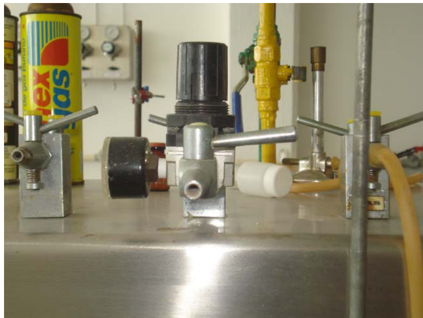
Figura 3. Servicios (Vacío, Aire, Gas)