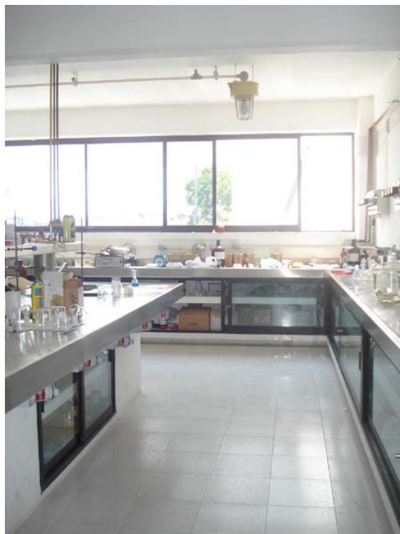
Figura 2. Vista lateral del laboratorio