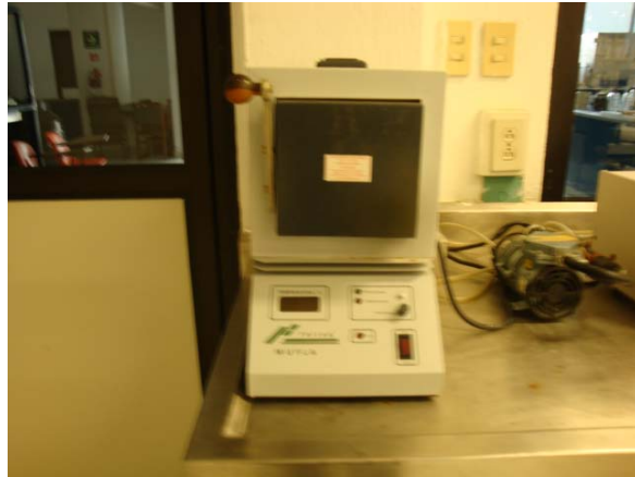
Figura 6. Mufla 2