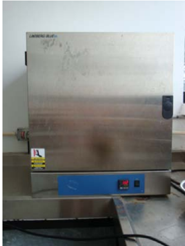
Figura 5. Mufla 1