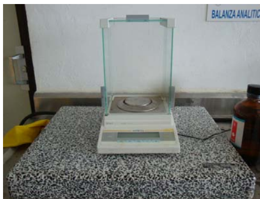
Figura 4. Balanza Analitica