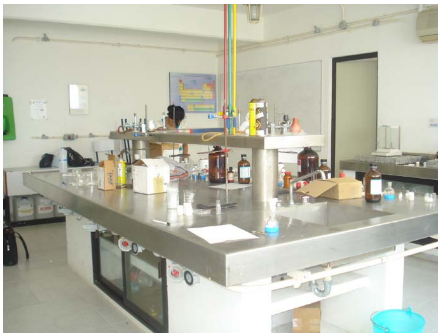
Figura 3. Laboratorio Síntesis Orgánica