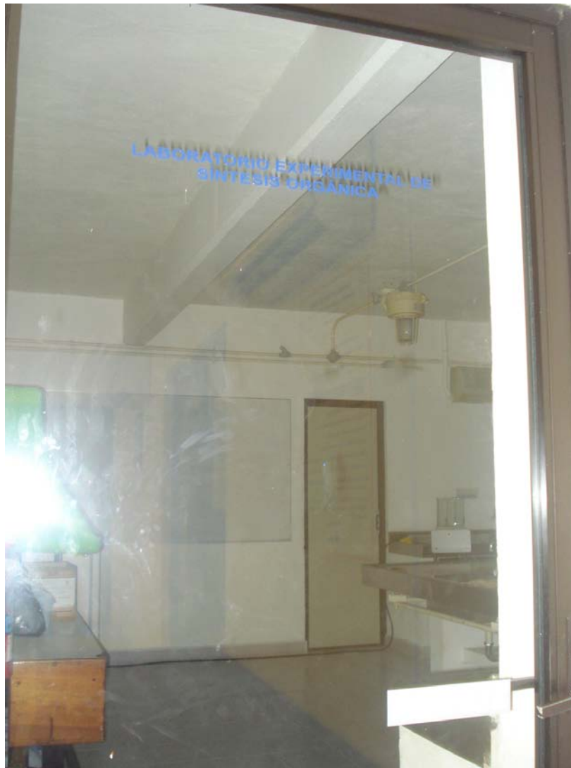
Figura 1. Puerta de Acceso al laboratorio