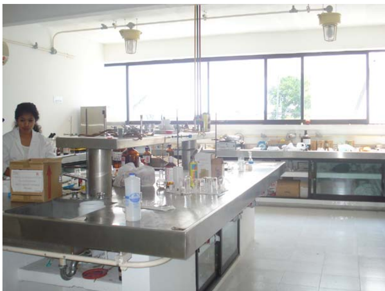
Figura 4. Laboratorio de Síntesis Orgánica