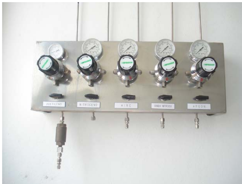
Figura 5. Servicios (Acetileno, Nitrógeno, Aire, Oxido Nitroso, Argón)