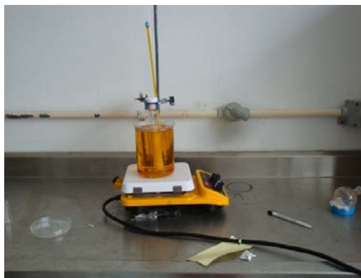
Figura 2. Parrilla de Calentamiento