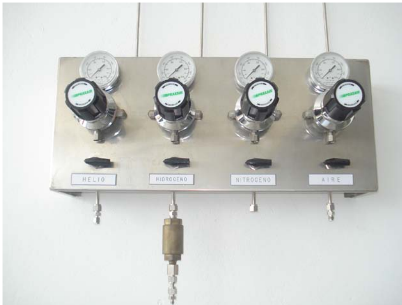
Figura 4. Servicios (Helio, Hidrogeno, Nitrógeno, Aire)