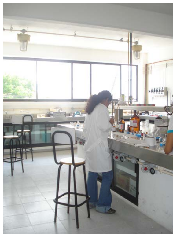
Figura 5. Área del laboratorio