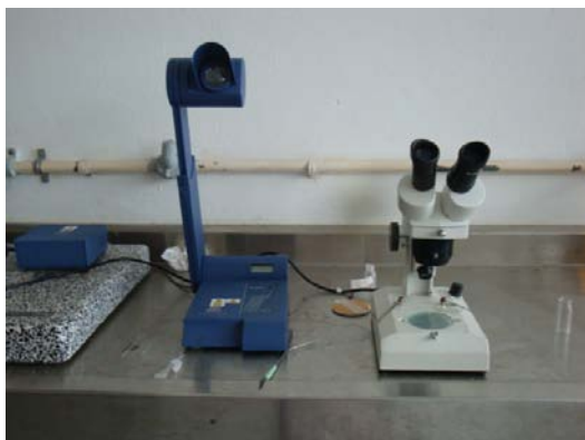
Figura 1. Microscopio