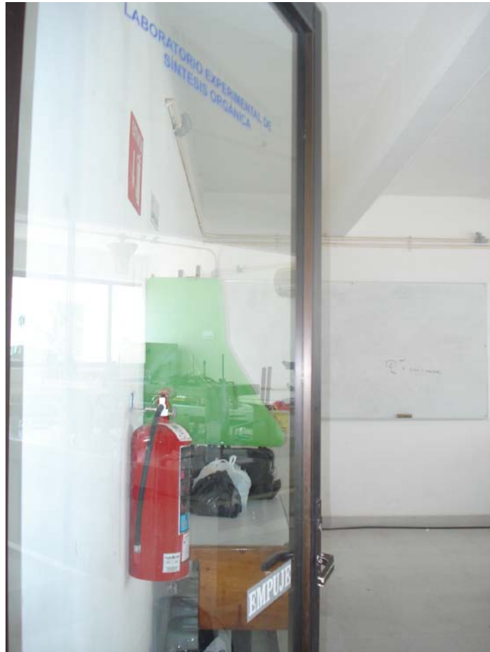
Figura 1. Entrada al laboratorio