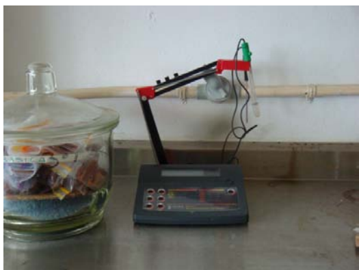
Figura 3. Potenciometro