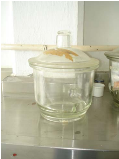
Figura 7. DeseCADORA de Vidrio