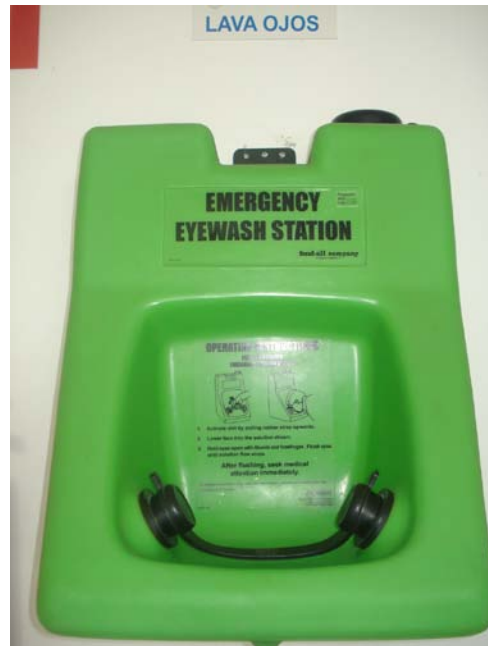
Figura 8. Equipo de Lavado de Ojos