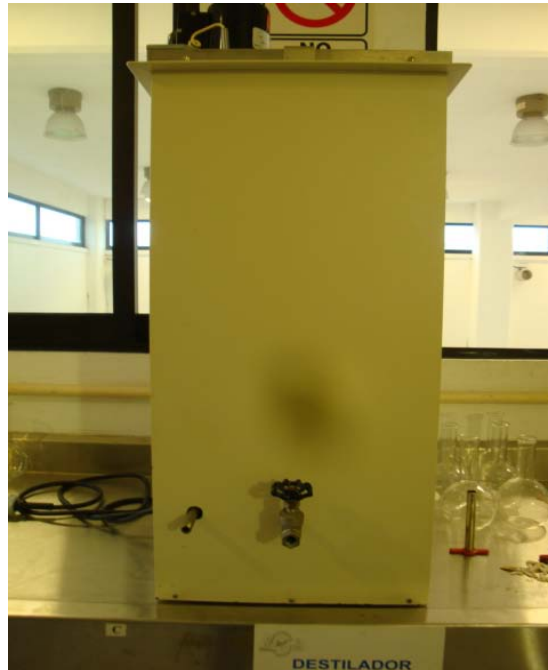
Figura 3. Aparato para determinar la Presión de Vapor Reid.