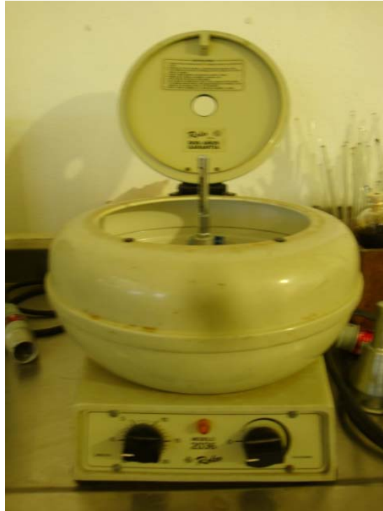
Figura 8. Centrifuga