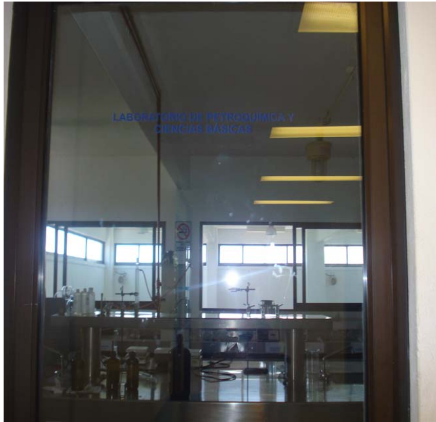
Figura 1. Acceso al laboratorio