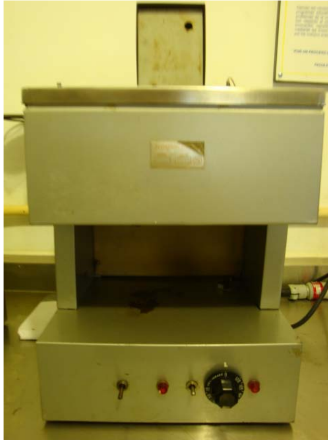
Figura 11. Viscosímetro Saybolt