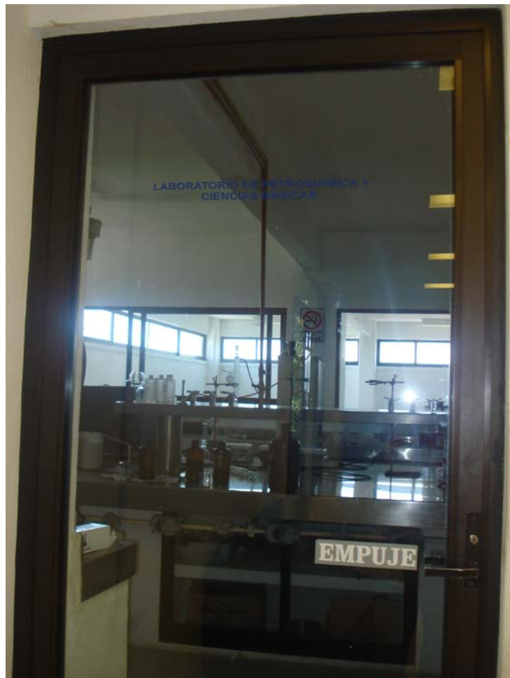
Figura 1. Acceso al laboratorio