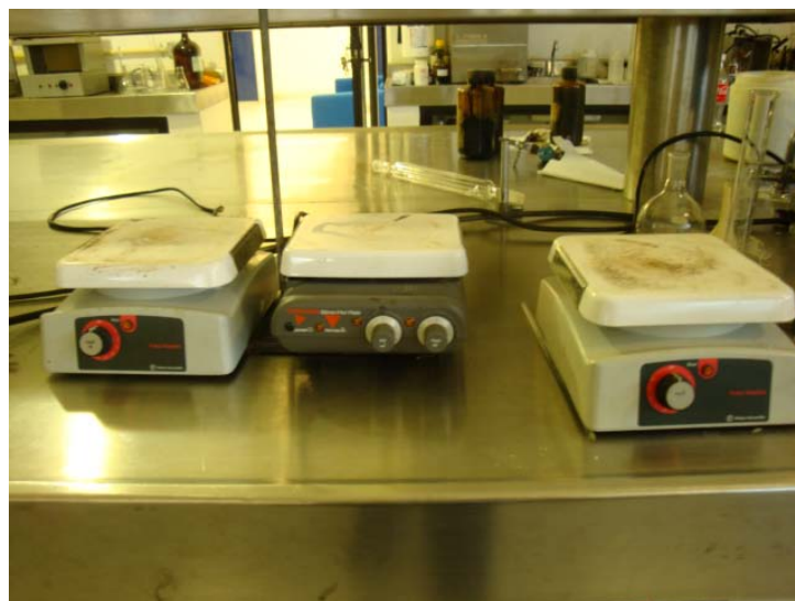
Figura 12. Parillas de Calentamiento y agitado.