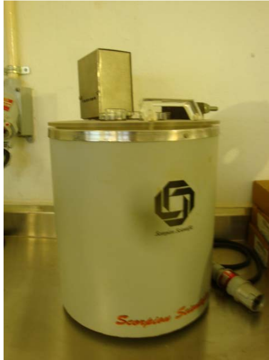
Figura 7. Baño para el punto de Congelamiento