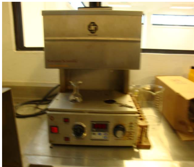
Figura 2. Viscosímetro Saybolt