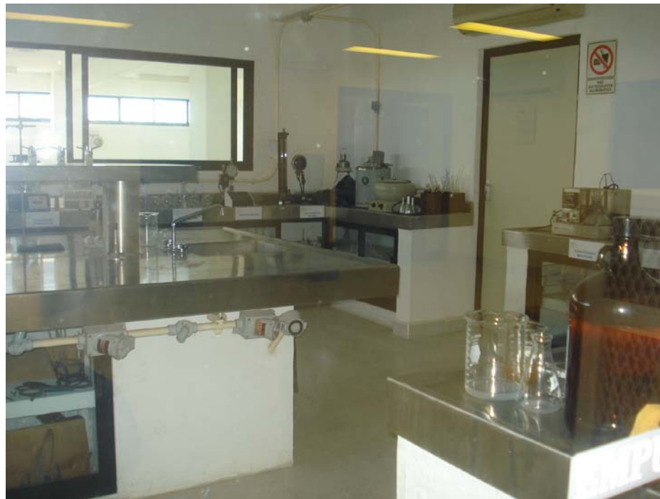
Figura 3. Vista lateral del laboratorio