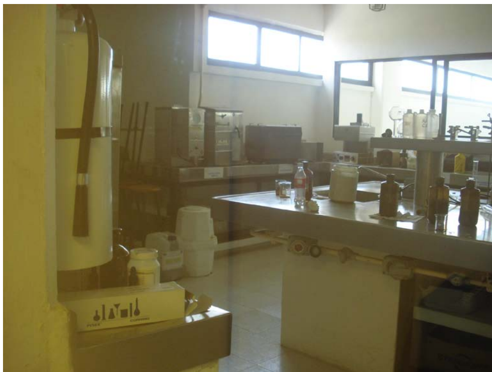
Figura 4. Vista lateral del laboratorio