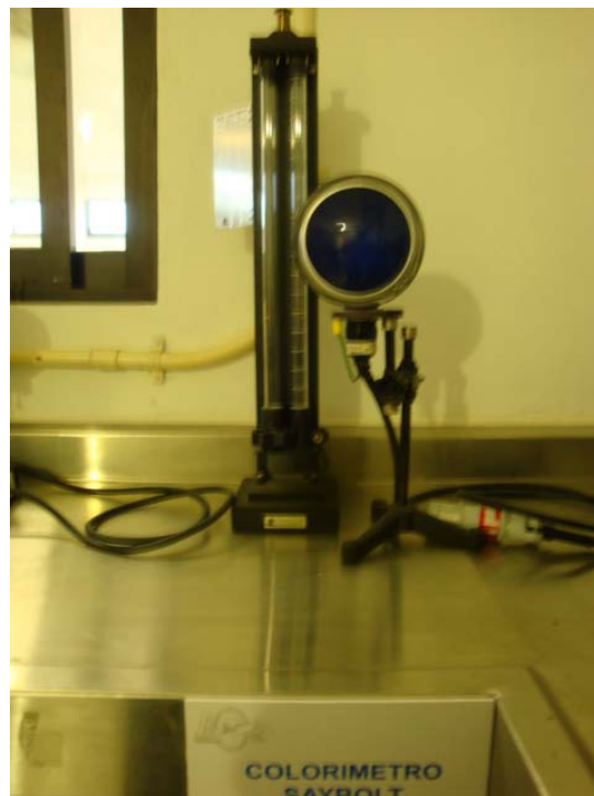
Figura 6. Colorímetro Saybolt