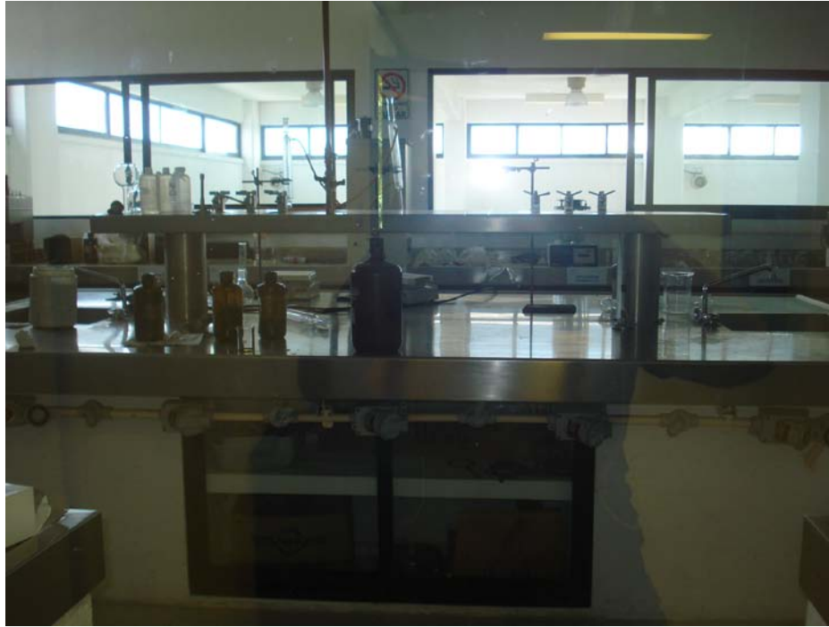
Figura 2. Vista frontal del laboratorio