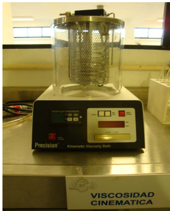
Figura 4. Equipo de Viscosidad Cinemática