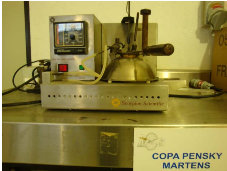
Figura 9. Copa Pensky Martens