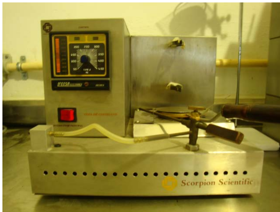
Figura 10. Copa Abierta de Cleveland