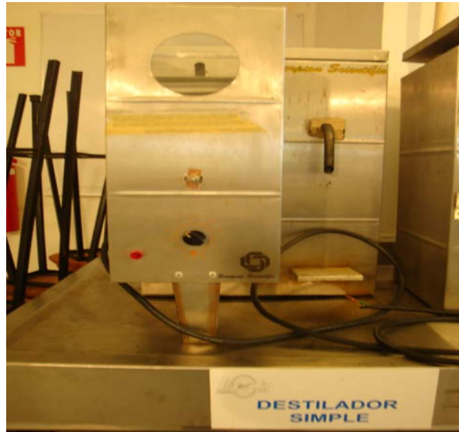
Figura 1. Destilador simple