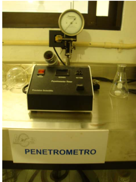
Figura 5. Penetrometro