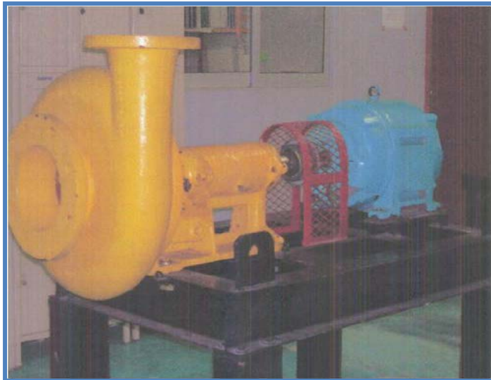
Banco de alineación