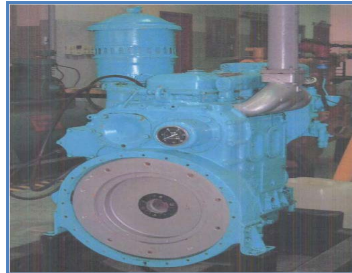
Motor Detroit Diesel Allison GM