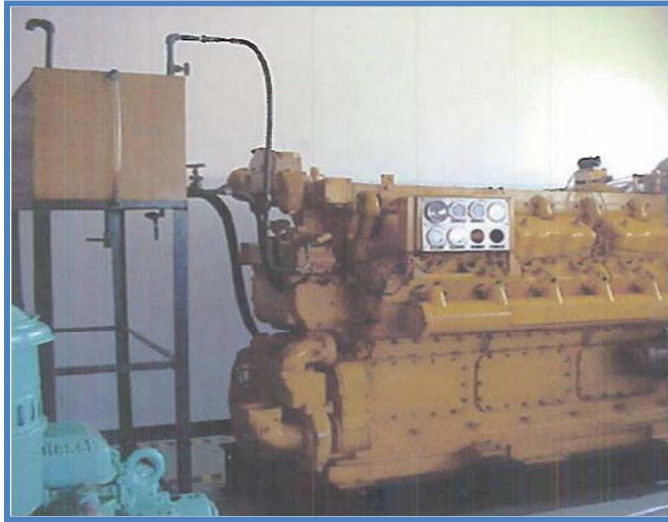
Motor de Caterpillar D398