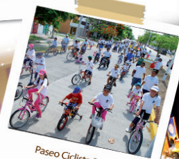
Paseo Ciclista 2011