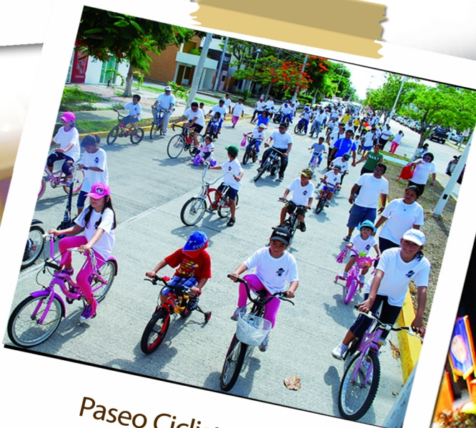
Paseo Ciclista 2011