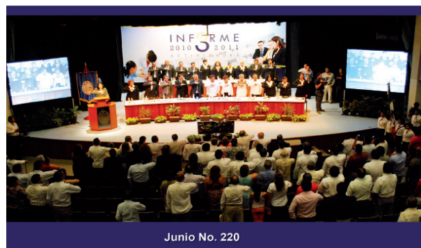
Junio No. 220