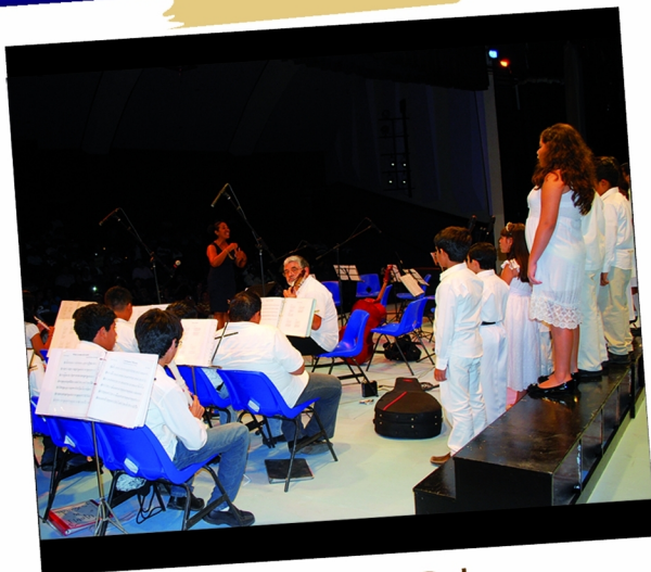
Concierto de Gala 44 Aniversario de la UNACAR