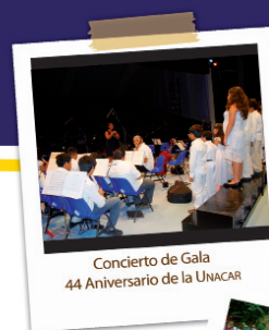
Concierto de Gala 44 Aniversario de la UNACAR