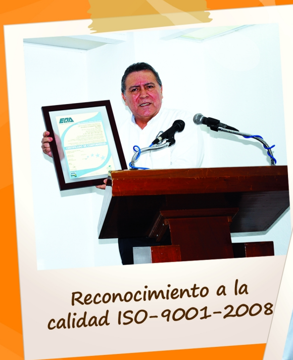
Reconocimiento a la calidad ISO-9001-2008