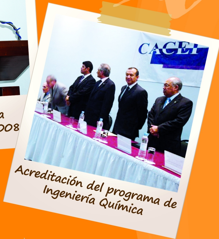
Acreditación del programa de Ingeniería Química