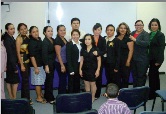
Los 14 egresados del primer seminario de titulación