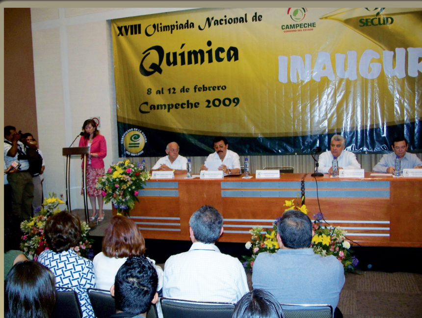
Inauguración de la XVIII Olimpiada Nacional de Química

Asimismo, se dieron a conocer los nombres de los 15 preseleccionados que serán preparados y seleccionados por la Academia Mexicana de Ciencias para integrar a las dos delegaciones, de cuatro integrantes cada una, que representarán a México en las olimpiadas Internacional e Iberoamericana, a realizarse próximamente en Cambridge (Reino Unido) y La Habana (Cuba), respectivamente.