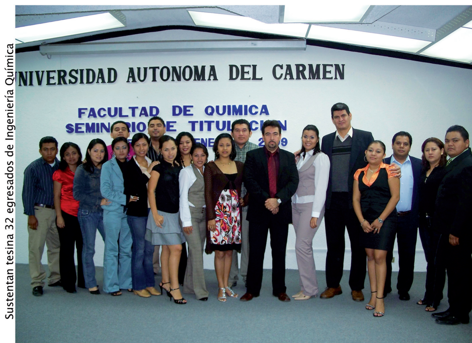
Sustentan tesina 32 egresados de Ingeniería Química