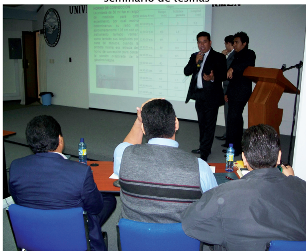
32 egresados presentaron proyectos