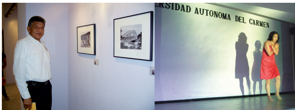
Muestra fotográfica entre destinos, puentes ferroviarios