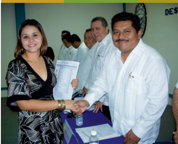
Entrega de Constancias