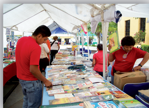
Aspectos de la Feria del Libro Universitario