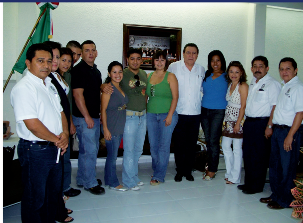
Bienvenida a los alumnos de casas de estudio de Sonora, Guadalajara y Colima