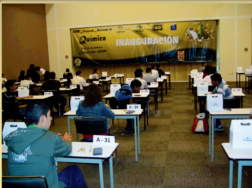
Aplicación de exámenes teóricos Olimpiada