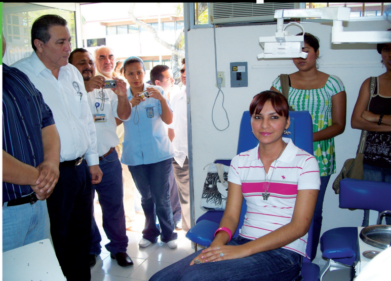
Puesta en marcha de la Campaña permanente Bucal en la Unacar