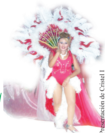
Presentación de Cristell I