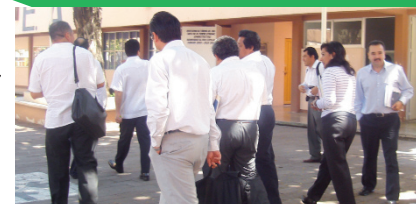
Recorrido con invitados por el Campus José Ortiz Ávila.