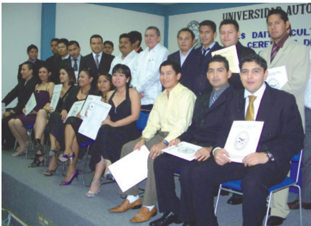
Graduación de los programas educativos de Ing. Civil, Electrónica, Eléctrica y Mecánica. Generación 2003 - 2008