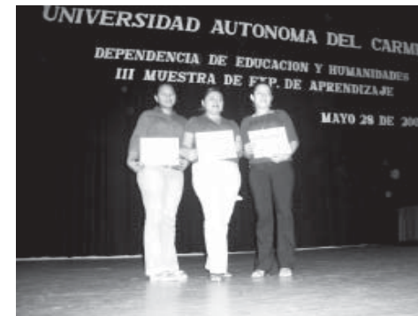
Alumnas del trabajo de investigación "Satisfacción Laboral en los docentes de la DES-DAEH".

Las alumnas indican que los docentes de la DES-DAEH están muy satisfechos. Tienen vocación, sienten amor por su trabajo y no les importan comprar el material con tal de impartir sus clases. El trabajo de investigación lo presentaron en el VI Encuentro Nacional de Estudiantes de Pedagogía y Ciencias de la Educación, que se llevó a cabo del 24 al 27 de mayo en Minatitlán, Veracruz.