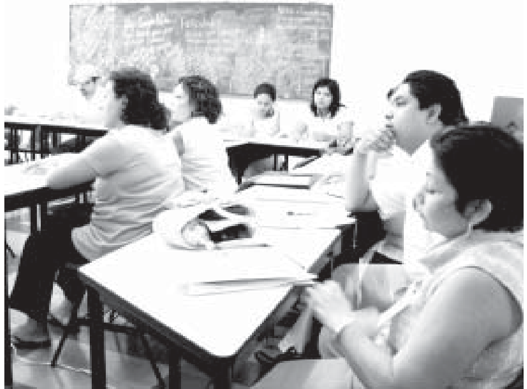
Se impartieron cuatro talleres simultáneos