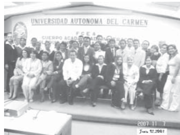
Maestros, empresarios y alumnos en el III Coloquio Empresarial Universitario.

Son enlaces cargados de conocimientos y sabiduría que dejarán en su formación personal y profesional una importante marca. Puede acceder a ellos mediante la página web de la UNACAR www.unacar.mx en el enlace de Biblioteca.