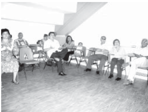
Pacientes del Centro de Rehabilitación Asistido por Computadora.

Otros pacientes también emitieron comentarios del avance rápido y notorio que tienen al recibir las terapias. Manifestaron gratitud a los responsables de este programa y reconocieron el trabajo de los alumnos de la carrera técnica de profesional asociado en rehabilitación de la DES-DACSA, que les dan asistencia.