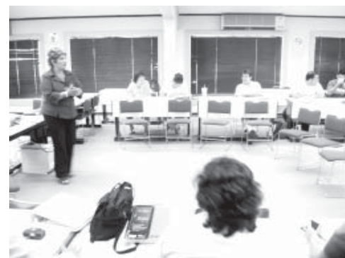
Docentes de cada una de las DES participaron en las etapas del Teacher training

Con esta intención, la Dirección de Superación Académica propicia la mejora de la calidad educativa, pensadas en el nuevo modelo educativo que no sólo beneficia a los docentes sino que también obtiene resultados en los alumnos para toda la vida.