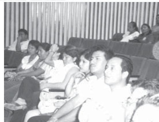
Maestros de la DES-DAEH presentes en las actividades de la III Muestra de Experiencias de Aprendizaje