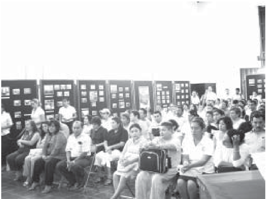
Participantes del encuentro.