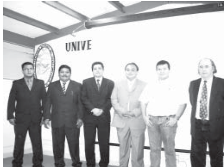
Alumno y cuerpo de sinodales.

Terminada la defensa de tesis del sustentante, y después de haber deliberado, el jurado dictaminó aprobarlo por unanimidad. El secretario del sínodo dio a conocer el veredicto y el presidente del mismo procedió a realizar la toma de protesta al nuevo maestro en ingeniería.