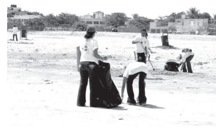
Alumnos de la UNACAR en la limpieza de playas.