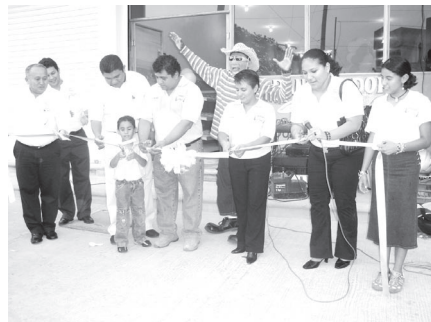
Tradicional corte de listón: rector, nuevo empresario y familia y asesora.