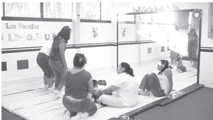
Alumnas trabajando con los niños en el Taller de Estimulación Temprana.