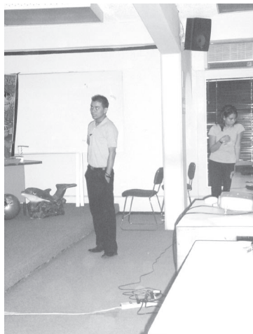
Alumno en la presentación de su proyecto dentro de la VII Expo Feria de Mercadotecnia.

Cabe destacar que además de la realización de estos productos para presentarlos en la Expo Feria, los jóvenes venden su trabajo, planean continuarlos y en un futuro hacerlos crecer y consolidarlos como una empresa.