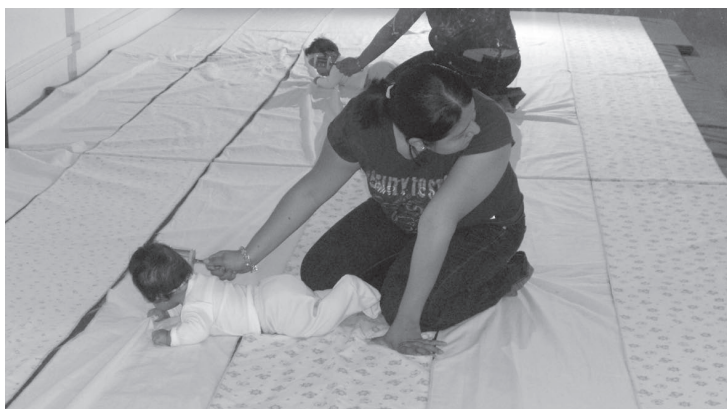
Alumnas trabajando con niños del primer módulo de 0 a tres meses.