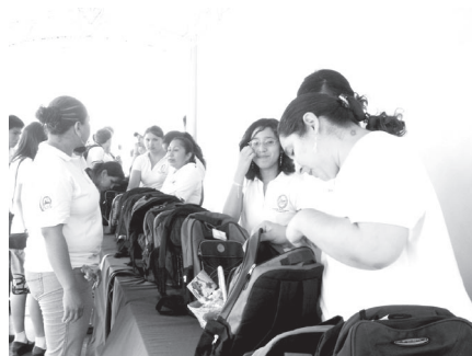
Maestros y estudiantes durante la entrega.