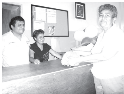
El nuevo empresario, su esposa y la primer cliente.

Recomendó a todas aquellas personas que tengan la inquietud de contar con negocio propio, a que se acerquen a EmpreSer . Las oficinas se encuentran ubicadas en calle 26 número 89, colonia centro. Número telefónico: 38 1 10 18 extensión 1410.