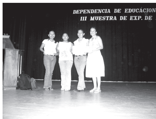
Alumnas responsables de la investigación Influencia de los medios televisivos en las actitudes de los adolescentes .

Entre los programas favoritos de los educandos se encuentran las animaciones japonesas, seguido por programas musicales y las telenovelas.