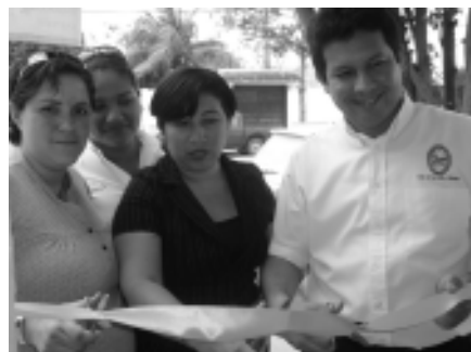
La nueva empresaria acompañada de la coordinadora de EmpreSer y del director del Centro de Innovación y Liderazgo.

Por último, recomendó a toda aquella persona que tenga deseos de emprender un negocio, a que se acerquen a EmpreSer . No se debe iniciar un negocio sin un estudio previo y EmpreSer garantiza la planificación para su buen funcionamiento. Además, te asesoran acerca de cómo se debe capacitar al personal que se contrata y cómo manejar la imagen que se le debe dar a la comunidad.