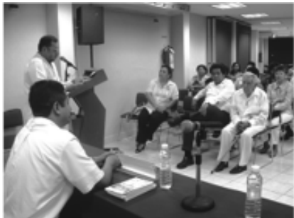
Panorámica de la presentación del libro Compendio histórico de Ciudad del Carmen .

El libro puede consultarlo en las bibliotecas de la localidad y adquirirlo en el Departamento de Fomento Editorial, ubicado en el Liceo Carmelita.