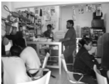
Instalaciones de CompuSoft .