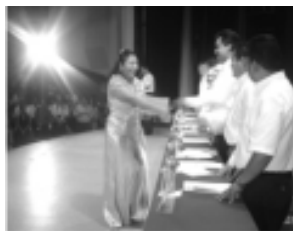
ENTREGA DE DOCUMENTOS

Enhorabuena a los nuevos profesionistas.