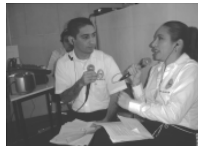
Total cobertura tuvo la inauguración.