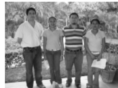
Biólogos y alumnos de licenciatura que apoyaron en las actividades.

Los visitantes también participaron en la actividad de etiquetar árboles de acuerdo con la especie a la que pertenecen. Realizaron visitas guiadas por las distintas colecciones del jardín, entre las que hay ornamentales, medicinales, tropicales y acuáticas.