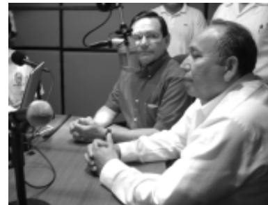
Entrevista en la cabina de trasmisión.

Hizo hincapié que consolidar un modelo a la altura de lo que reclama la sociedad carmelita en materia de cultura e información sana. Es un paso importante que da la Universidad Autónoma del Carmen, advirtió.