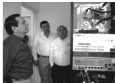
El gobernador conoce el transmisor