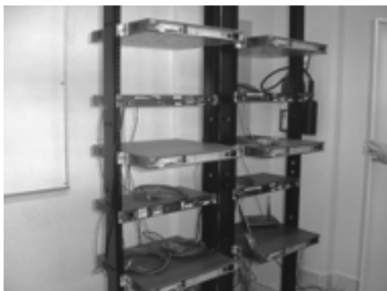
Routers y switches para las pruebas de redes