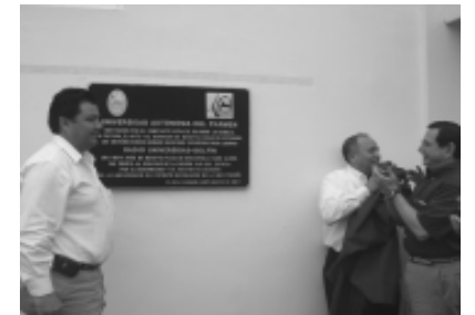
Momento histórico fue la develación de la placa.