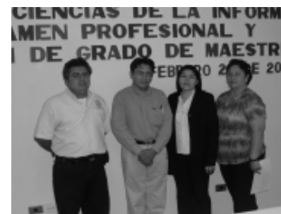
Sínodos en compañía del nuevo maestro.