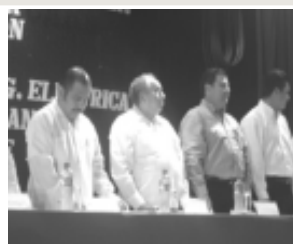
EL ALCALDE JOSÉ IGNACIO SEARA SIERRA, PADRINO DE LA GENERACION.