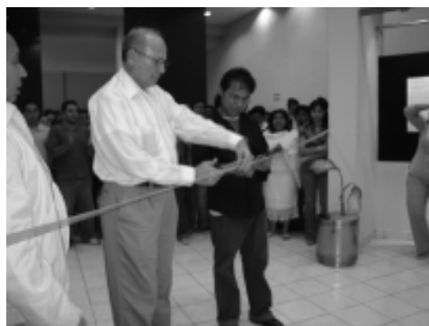
Inauguración de la exposición.

La exposición permanecerá abierta al público en la Galería del Centro Cultural Universitario hasta el día 4 de abril. Si tiene inquietud por conocer esta interesante propuesta artística, asista, aún esta a tiempo.