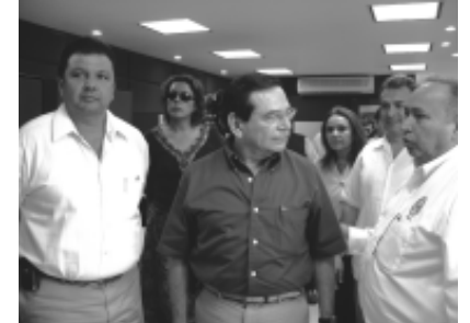
Conocieron también las instalaciones.