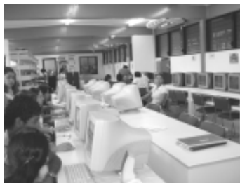
Centro de Apoyo y Documentación para el Aprendizaje de Lenguas.

Ofrece servicios de acervo bibliográfico en cada una de las asignaturas de las carreras de la facultad, préstamo interno de discos compactos, videos y casetes de audio para ayudar a los estudiantes a mejorar la comprensión auditiva y la expresión oral tanto de la lengua oficial como del idioma inglés; también, préstamo de libros, de equipo de cómputo con acceso a Internet y asesorías por parte de los responsables del centro.