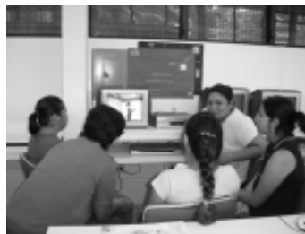
Alumnos utilizando uno de los servicios del CADEA.