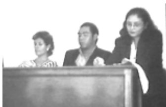
Mesa de trabajo en el tercer Congreso Nacional de Comunicación

Los participantes del congreso eran profesores e investigadores en el área de la comunicación, directivos de organizaciones informativas y de instituciones educativas, así como funcionarios de empresas relacionadas en diferentes ámbitos de la disciplina.