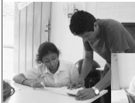
Asesor y alumno de alfabetización.

Este departamento, en nuestra casa de estudios, está a disposición de la comunidad en general, en los turnos de 9:00 a 14:00 y de 16:00 a 20:00 horas, de lunes a viernes.