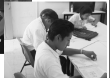
Alumnos de nivel no escolarizado.