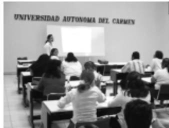
Durante la capacitación a docentes.