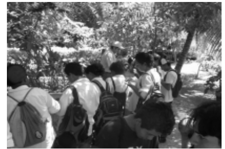
Alumnos de la Escuela Secundaria Técnica Comercial Miriam

Para finalizar la visita, los anfitriones del Jardín Botánico aplicaron a los jóvenes una evaluación acorde al nuevo modelo educativo que se implementó en nuestra máxima casa de estudios.