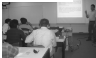
Presentación de los proyectos.

Los 10 proyectos presentados -explicó- tienen la característica de poder ser desarrollados en algún momento, ya que cuentan con los requisitos asentados en la Norma Oficial Mexicana NOM-001-SEDE-1999, la cual establece la