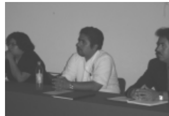
Cuerpo de sinodales.

La defensa de la tesis se llevó a cabo en la Sala Audiovisual de dicha facultad con la asistencia de académicos, alumnos y familiares.