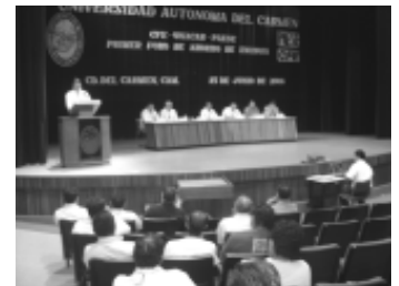
Primer Foro de Ahorro de Energía.