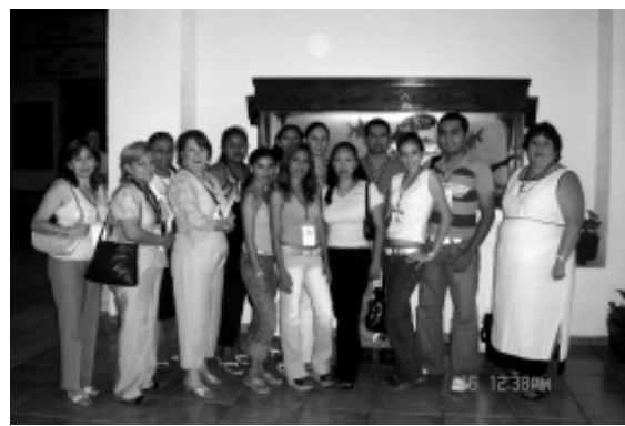
Ganadores que asistieron al congreso

para el próximo año, en el marco de la tercera exposición de emprendedores se abrirán nuevas categorías que permitan ubicar en su contexto la diversidad de planes de negocios que se presenten.