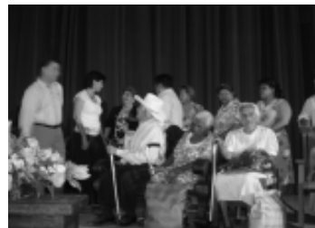
El presidente municipal hizo entrega de reconocimientos y bastones a los más longevos de la isla.

Para el desarrollo de los festejos se integró un comité donde participan diversas personas e instituciones de la localidad, entre