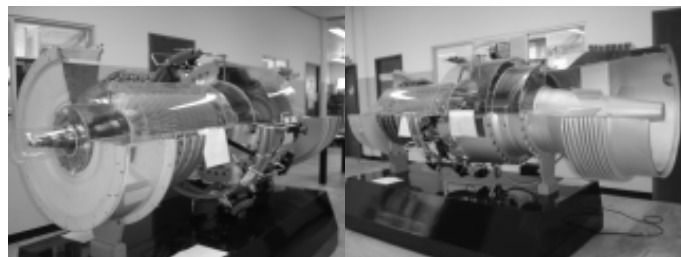
Turbina de gas, marca Solar, modelo Taurus 60.

dcaanova@pampano.unacar.mx, dcaanova_98@yahoo.com