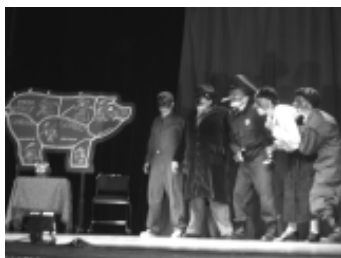
El arte de la improvisación se vio reflejado en Ser o cer...do .