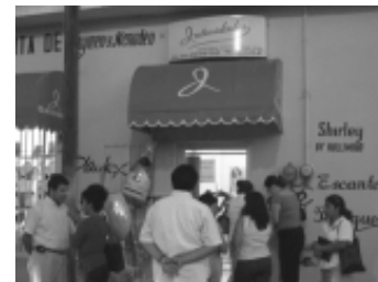
Inauguración del negocio de ropa íntima Intimidades

Si usted está pensando en iniciar su propio negocio y no sabe por dónde empezar, no lo dude y acuda al local señalado con el número 89 de la calle 26 de esta ciudad o comuníquese al teléfono 381-10-18 extensión 1410. Si lo prefiere para consultar más detalles visite la siguiente página electrónica www.empreser.org . Verá que en la actualidad no existen obstáculos para emprender su propio negocio.