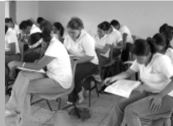
Los estudiantes presentaron el Preexani II.

Preexani II es una evaluación creada y diseñada por la Coordinación Nacional para la Planeación de la Educación Superior (Conpes). Se estructura y elabora en el Centro Nacional de Evaluación para la Educación Superior, A.C. (Ceneval), con