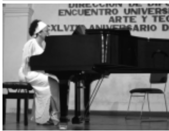
Muestra de la clase de piano.