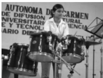
Alumna en el ensayo de batería.