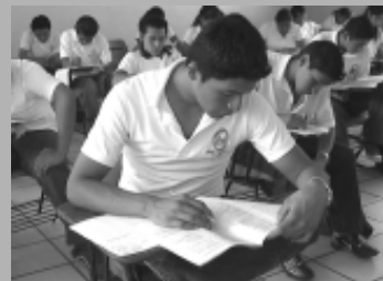
El examen evaluará el aprovechamiento escolar.

base en las normas, políticas y criterios que establece su consejo técnico, el cual está integrado por académicos e investigadores de reconocido prestigio en los ámbitos de la educación y la evaluación del aprendizaje escolar, representantes de instituciones de educación superior de alcance nacional y representantes de los órganos gubernamentales encargados de los asuntos educativos de los estados.