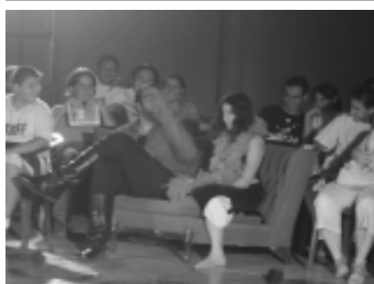
Ángel y Angélica, personajes de Dos de Amor .