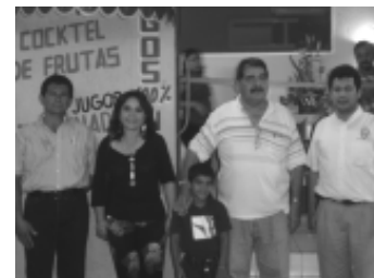
Inauguración del restaurante El Manguito.