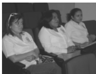
El comité evaluador del Coloquio

A los ganadores se les hizo entrega de la Enciclopedia de la Laguna de Términos , editada por la Unacar, además de su constancia de participación con las respectivas menciones honoríficas a los trabajos premiados.