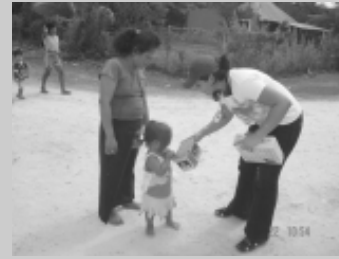
Alumna con niños beneficiados.