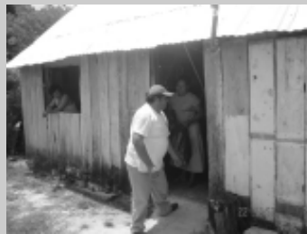
Estudiante entregando despensa.