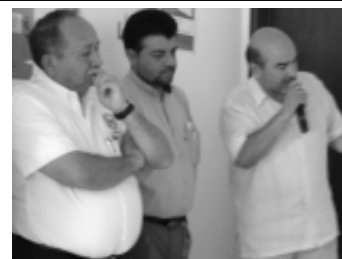
El subdelegado estatal de la Condusef, Jorge Aceves Rosas, explicó los servicios del módulo.