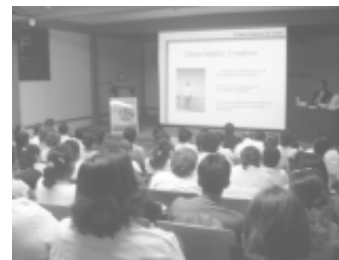
Maestros y alumnos en la presentación del libro.