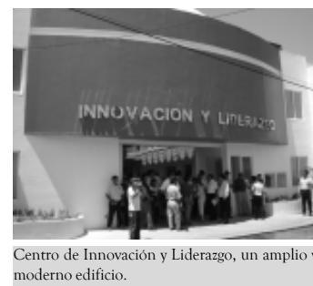
Centro de Innovación y Liderazgo, un amplio y moderno edificio.