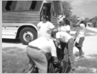
Acopio y acomodo de la ayuda.

Con labores como éstas la Universidad Autónoma del Carmen refrenda su compromiso con la sociedad.