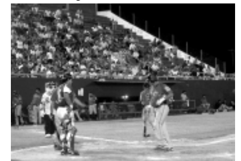
Buena asistencia de aficionados en la fiesta beisbolera que se realizó en el estadio Resurgimiento del 16 al 19 de marzo del presente.

Complementarias: En los tres primeros encuentros se contó con la graciosa participación de la mascota de los Tigres de la Angelópolis, el popular Chacho, quien deleitó con sus ocurrencias a chicos y grandes que se dieron cita en el Estadio Resurgimiento.