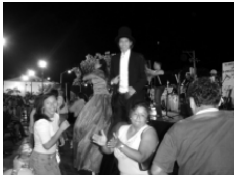
La comunidad, está adoptando esta fiesta de primavera como algo representativo de nuestra entidad.

Los días sábado 25 y domingo 26 de marzo, por la noche, se vivió una vibra distinta en las calles del Centro Histórico de Ciudad del Carmen. Se trató de la segunda edición del Festival de Primavera, organizada por la Universidad Autónoma del Carmen y el gobierno de nuestra entidad. Fue una invitación para que la ciudadanía, entre festejos, tomara las calles.