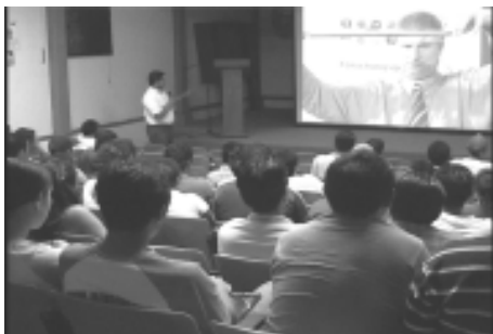
Alumnos atentos a los talleres impartidos durante la Semana de ingeniería .