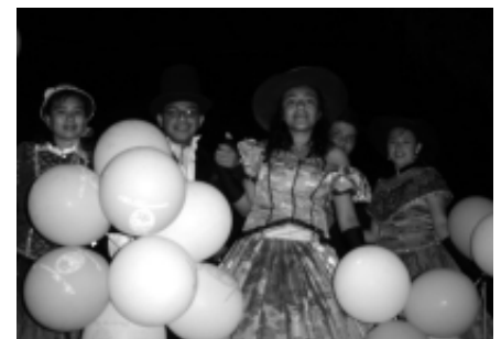
En esta ocasión el bando de zanqueros, portó el traje de gala alusivo a los festejos de titulación de la ciudad.