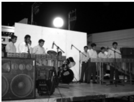
Excelente la participación del grupo de marimba del municipio de Tenosique, Tabasco.