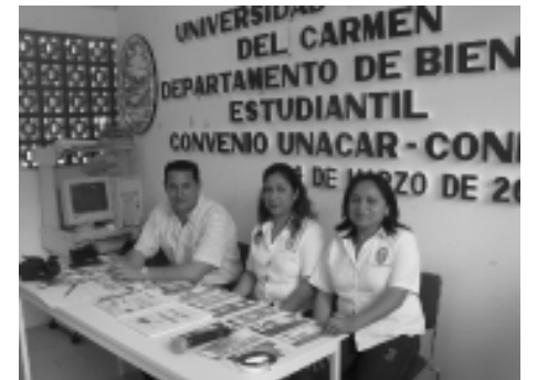
Establecen módulo Condusef en Unacar.