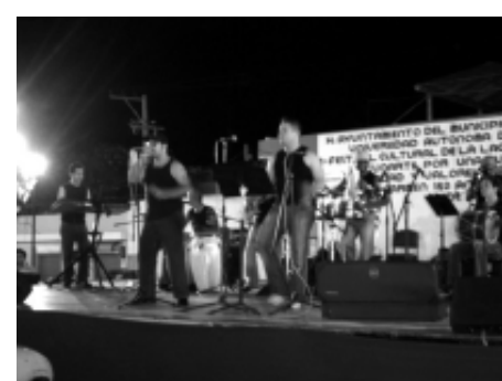
La Bomba Dominicana, levantó con sus ritmos a más de uno de sus asientos.