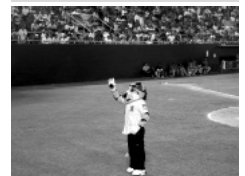
Chacho, mascota de los Tigres de la Angelópolis, estuvo presente en el Estadio Resurgimiento.