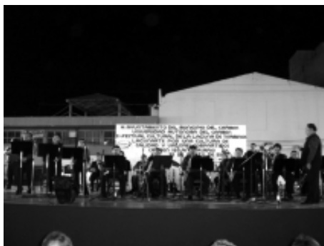
La Orquesta del Instituto de Cultura de Campeche, ejecutó con gran maestría, piezas de danzón.