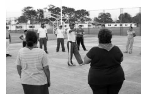
En la actividad, los alumnos y las personas comparten experiencias y opiniones para un mejor desarrollo.

Hizo hincapié que con apenas dos meses de haber iniciado con el programa, la aceptación y participación ha sido satisfactoria. Los alumnos han logrado una labor notable, y con ello, se ve reflejado el conocimiento que adquirieron en las aulas. “A parte de lo aprendido en clase, los alumnos investigan nuevas prácticas, no se quedan con una opción, y eso, como docente, nos llena de orgu-