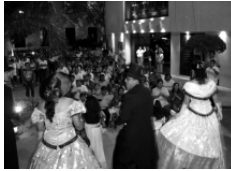
La segunda edición del Festival de Primavera, toda una algarabía entre el pueblo carmelita.

El sábado 25, a partir de las 19:30 horas, inicio el festín con la participación del grupo de zanqueros y de la Charanga Universitaria. El desfile de zanqueros y músicos, acompañados de un grupo de señoritas que portaban el traje representativo de la mujer carmelita. Poco a poco, al paso del contingente, se llenaron las calles desde el parque Morelos en el barrio de Tila hasta el Centro Cultural Universitario, donde el grupo Los Románticos , dieron una dosis de romanticismo y nostalgia al interpretar melo-