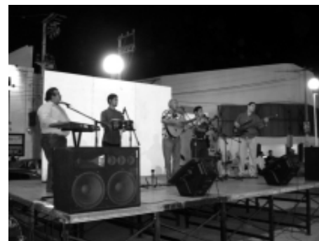
El grupo Los Románticos, una de las principales agrupaciones, con las que cuenta la Unacar.