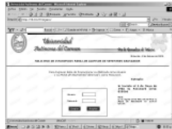
Para ingresar se proporciona la matrícula como usuario y su fecha de nacimiento (ddmmaa) como password.