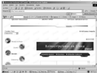
El link de las reinscripciones se encuentra en la página web de la Unacar.

Para mayores informes acerca del proceso de inscripción, pueden dirigirse al Departamento de Control Escolar, ubicado en las oficinas de la Rectoría, o visitar la página de la universidad, www.unacar.mx en el portal de alumno.