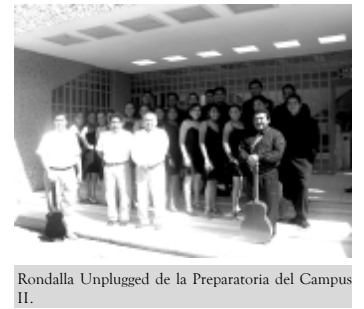
Rondalla Unplugged de la Preparatoria del Campus II.