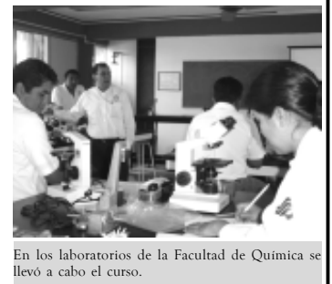
En los laboratorios de la Facultad de Química se llevó a cabo el curso.

El curso fue impartido en los laboratorios de la Facultad de Química, donde participaron más de 20 docentes del área de investigación. El curso ayudará a la reducción de costos por mantenimiento, ya que los mentores adquirieron los conocimientos básicos y precisos sobre el cuidado de los instrumentos.