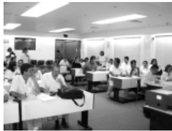
Taller de estudio de casos, al cuerpo docente de las Dependencias de Educación Superior a través de la ANUIES.