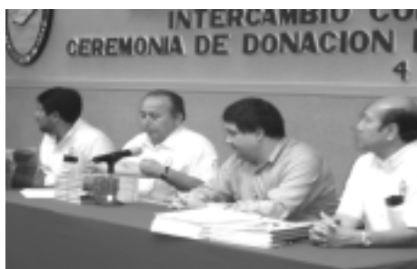
Autoridades universitarias encabezaron el acto de donativo del software musical