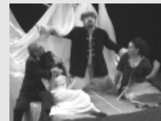
Escena de El nuevo mundo , del taller de teatro de la Universidad Olmeca, de Villahermosa, Tabasco.