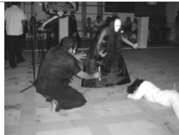
El performance, fue uno de los actos que más llamó la atención de los asistentes.