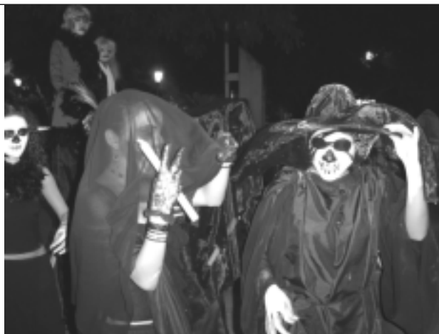
La representación de la muerte, no podía faltar en esta tradición.