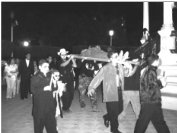
La procesión dejó atónitos a más de uno.