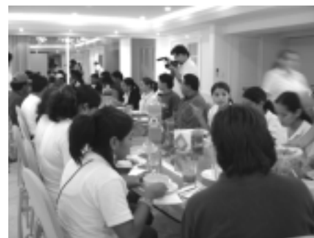
Los representantes de la comunidad estudiantil y productores agropecuarios del municipio de Candelaria

Durante la plática que sostuvieron con el rector de nuestra institución, éste les manifestó que no se puede establecer una carrera o un programa educativo, si no se tiene claro a qué parte del sector productivo va dirigido. Reconoció que la región de Candelaria tiene un futuro prometedor. La universidad, como institución de educación superior, tiene la obligación de investigar y realizar los estudios pertinentes para determinar las fuentes de empleo que el profesio-