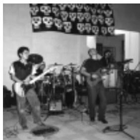
Grupo de rock Rosa Negra