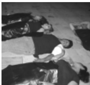
Los alumnos, dejaron salir a flor de piel, su creatividad.