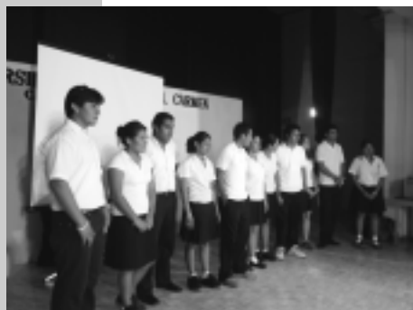
Los alumnos de intercambio, expusieron sus vivencias