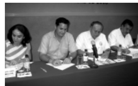
Firma de Convenio entre la Condusef y la Unacar que ofrecen las instituciones financieras y, a la vez, defender el derecho de los usuarios en casos de controversia.

El convenio de colaboración permitirá a la Condusef que estudiantes de la Unacar sean asignados a ese organismo para prestar su servicio social, coadyuvando en la orientación y asesoría al público para hacer mejor uso de los productos y servi-