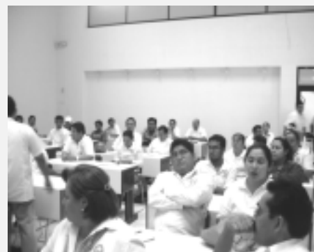
El personal docente de la Unacar se prepara día con día para poder ofrecer una enseñanza de calidad

Con esta intención, la Unacar genera estas actividades que propician la mejora de la calidad educativa, pensadas en el nuevo modelo educativo que no sólo beneficia a los docentes sino que también obtiene resultados en los alumnos, creando una mejora para la vida misma.