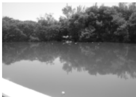
Arroyo de Caleta, una belleza natural que estamos perdiendo

En abril de 2006, la Unacar pretende tener las propuestas para la mejora, no sólo de la Caleta, sino del medio ambiente en general, debido a que los aspectos ecológicos del entorno son de suma importancia para nuestra comunidad, pues en la medida que se conserve la ecología de la región, se tendrá una mejor calidad de vida.