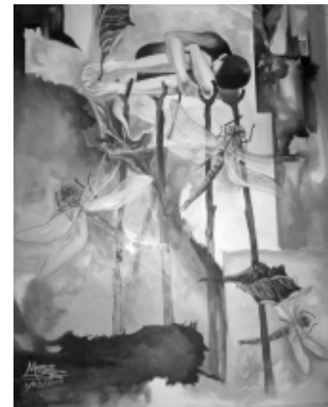
Sueño fingido bajo lágrimas de otoño , es la obra que ya forma parte del acervo pictórico de esta importante muestra.