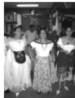
La muestra contempló la exhibición de algunos trajes típicos del sureste mexicano