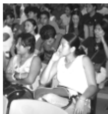
Alumnos y docentes durante la conferencia

la conferencia de los docentes se refirió a la estructura del cerebro, cómo se crea la percepción, el proceso de la elaboración de los mapas mentales, las diversas aplicaciones, su utilización en el aula, y en la evaluación, la forma de organizar proyectos para lograr una mejor comunicación, en general su aplicación didáctica.