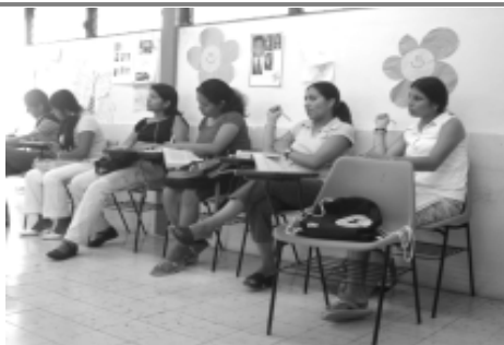
Brinda la Unacar excelente oportunidad para contribuir en el desarrollo de la educación en Ciudad del Carmen

El asesor voluntario, tendrá a su cargo realizar diversas actividades con grupos asignados, los cuales tendrá que apoyar, dirigir, y orientar. La ventaja de formar parte del programa llevado a cabo por el Instituto Nacional de Educación Abierta (INEA), es que les ofrece retribución económica