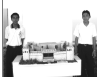
Los alumnos desarrollaron su capacidad creativa

-El arte de las grandes civilizaciones fue el tema central de esta muestra