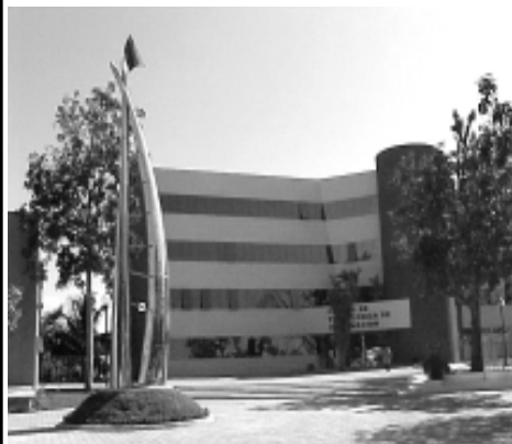
Moderno edificio del Centro de Tecnologías de la Información

Es importante hacer mención que el servicio que brinda este edificio, es de siete de la mañana a nueve de la noche y los sábados de ocho a catorce horas.