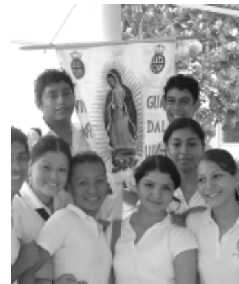
Alumnos del primer semestre con la bandera primigenia

un concurso de presentaciones gastronómicas, donde todos los alumnos de la facultad, adornaron un espacio el cual se les indicó, que debía ser representativo al mes patrio. De igual forma, se llevó a cabo, el concurso de la “Chica y el Chico Independencia”, que fue del total agrado de docentes y alumnos, donde calificaron, presentación, porte, actitud y sobre todo mucha popularidad.