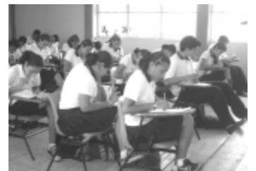
Alumnos del primer semestre presentando el examen correspondiente de la primera parte de la Olimpiada lógica.

Por último, agregó una cordial invitación a todas las preparatorias incorporadas a la Unacar, a unirse en dicho evento, y que se acerquen a la Academia de Humanidades, y con gusto los atenderán, ya sea para algún dato o si requieren preparación para la olimpiada.