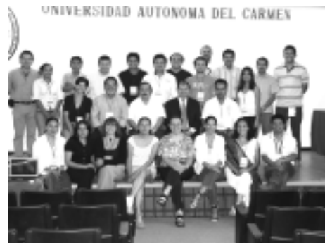
Grupo de investigadores extranjeros y nacionales, en compañía de los organizadores de esta actividad