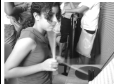
Alumna recibiendo sus primeras clases de percusiones