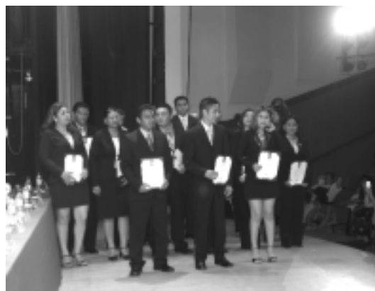
17 jóvenes de licenciados en administración de empresas recibieron Testimonio de Desempeño Satisfactorio