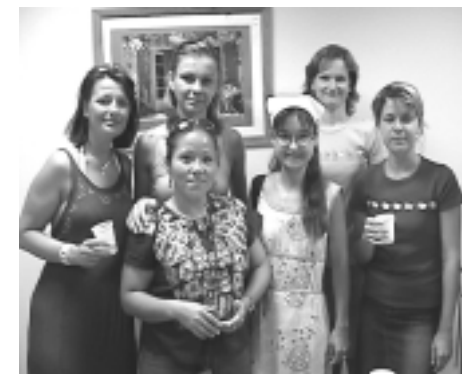
Alumnas del curso

bajo en favor de la educación. Es un orgullo formar parte de la formación de los estudiantes del idioma francés, pero a la vez es una gran responsabilidad. Este viaje enriqueció mis conocimientos, me ayudó a perfeccionar el idioma en todos los sentidos y a aprender nuevos métodos de enseñanza para ofrecerlos en la universidad, así como a la comunidad en general”. “Por otra parte, esta experiencia ha permitido la creación de un círculo de comunicación entre los profesores de francés de todas las partes del mundo, además del contacto permanente con la institución francesa en donde realicé el curso. Este círculo a distancia será una herramienta más en la búsqueda de información y en la obtención de asesoría. Por todo esto, agradezco a la Embajada de Francia en México la oportunidad de recibir esta beca y, de manera especial, a mis profesores en