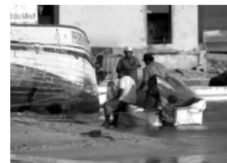
Pescadores ribereños de escamas en Ciudad del Carmen.

La cultura interna a la RLT es la ribereña construida por la relación que el hombre establece en y con las lagunas, ríos y zonas costeras marítimas. De ella se deriva la cultura pesquera, la navegación, el comercio de cabotaje, la carpintería de ribera como las representativas de una cultura milenaria en el mundo cuando el hombre tuvo presencia en este planeta. La cultura externa a la RLT es la extractiva de los recursos naturales construida con base a las dinámicas y procesos que demandan otras sociedades en favor de sus economías. Tal es el caso de la cultura agroforestal que benefició a Europa entre los siglos XVII y XIX, y las culturas marina industrial y petrolera, cuyos productos y ganancias han sido en beneficio de Estados Unidos.