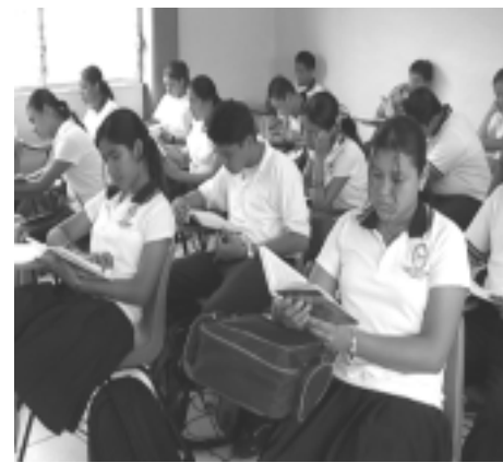
Alrededor de 1,500 alumnos participan de forma simultánea en esta actividad.