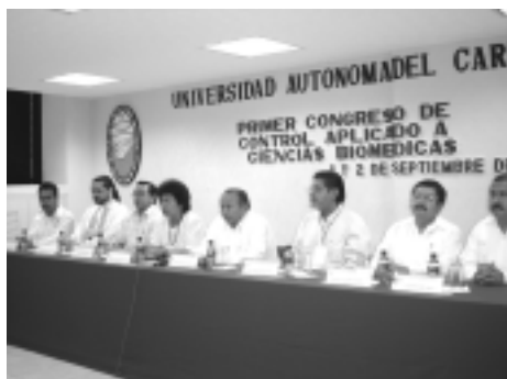
Personalidades del honorable presidium en el momento de la inauguración

Con esta actividad la Unacar apertura la frontera del conocimiento en su frente común, haciendo de varias áreas de investigación un ámbito donde las soluciones son innovadoras y de la más alta calidad, donde sus trabajos son presentados no sólo a la comunidad científica sino también en general.