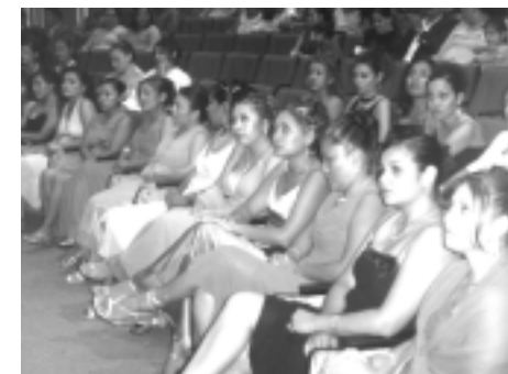
Un total de 47 alumnos egresaron de la Facultad de Ciencias Educativas