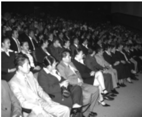
76 nuevos profesionales egresaron de la Facultad de Comercio y Administración

Un total de 76 nuevos profesionales recibieron sus certificados de contador público y auditor (36), y de licenciatura en administración de empresas (40), de los cuales 29 obtuvieron la titulación automática a través del Examen General para el Egreso de la Licenciatura (EGEL) aplicado