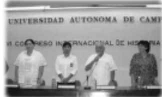
Autoridades universitarias y del gobierno local durante la inauguración del VI Congreso internacional de historia oral, en la ciudad de Campeche.

La Asociación Mexicana de Historia Oral y la Sociedad de Historiadores Campechanos organizaron el VI Congreso internacional de historia oral. Más de 40 centros de estudios y de investigación de siete países se dieron cita en la Universidad Autónoma de Campeche para intercambiar experiencias y debatir en torno al eje temático La oralidad y el conocimiento social .