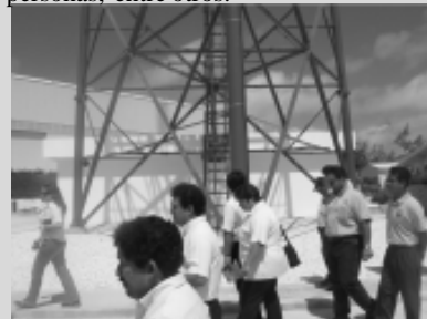
Funcionarios de la Unacar visitaron el CASES

talaciones en agosto del 2004 en un área de cuatro mil metros cuadrados. Consta de áreas de urbanización y de prácticas de técnicas de sobrevivencia en el mar, alberca techada, área de prácticas de técnicas contra incendios, seis aulas de capacitación para 24 trabajadores cada una, comedor, oficinas administrativas, sala de usos múltiples con capacidad para 150 personas, entre otros.