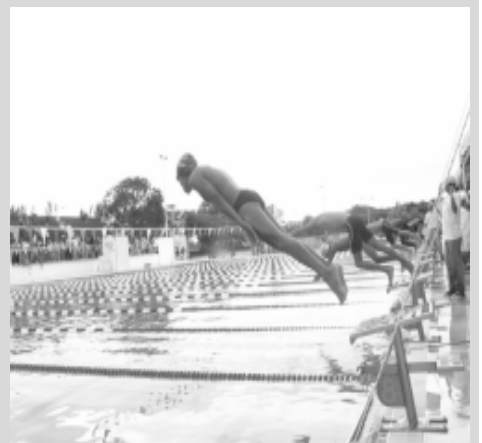
Del cuatro al ocho de julio se llevó a cabo el curso de natación para entrenadores y licenciados en educación física

Participaron licenciados y entrenadores de natación de los clubes locales, quienes de esta manera adquirieron los conocimientos sobre las técnicas vigentes de esa disciplina deportiva en todo el mundo.