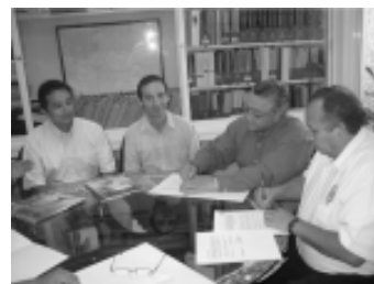
Representantes del Centro Educativo Latino y de la Unacar, presentes en la firma del convenio de colaboración entre ambas instituciones.