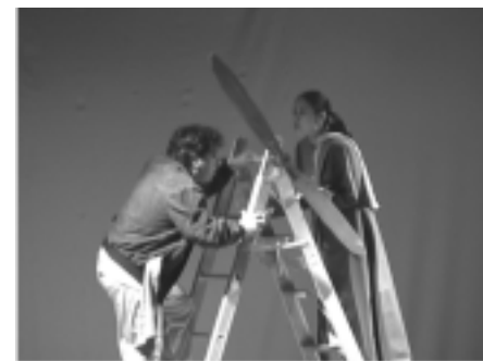
La Bambalina de Quintana Roo, con la obra El Principito