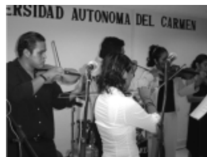
Ensamble de cuerdas