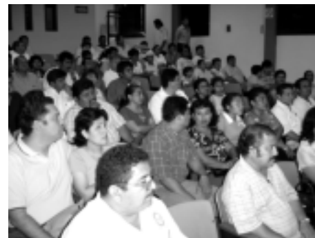
Familiares y compañeros de trabajo se unieron para celebrar este acontecimiento