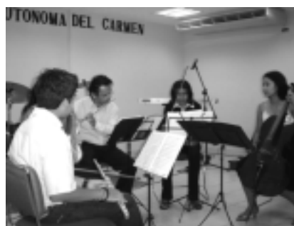
El grupo Cuerdas y flautas