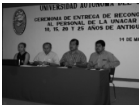
Personalidades institucionales conformaron el presidium.

A todos ellos... ¡muchas felicidades!, porque se escucha fácil, pero se requiere de un gran esfuerzo.