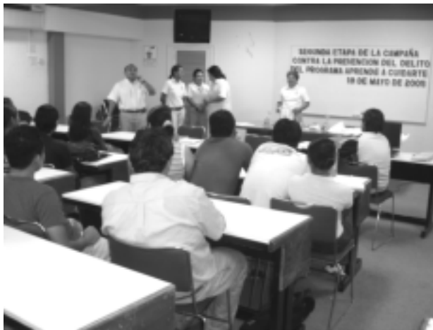
Los jóvenes estuvieron muy atentos a las recomendaciones de los instructores

Por último, la docente comentó que su plan de trabajo a futuro es llegar también a los jóvenes de secundaria e informarlos y prevenirlos en cuestión de drogas, alcohol y todos aquellos temas de cuidado que afrontan los estudiantes hoy en día.