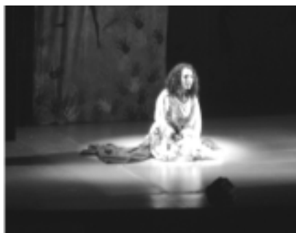
Diosas del olvido de la compañía teatral Ábrego de España