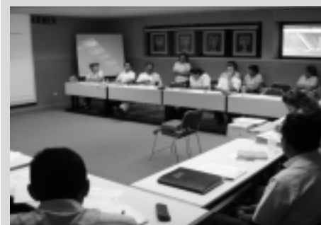
Líderes de los diferentes cuerpos académicos

El secretario Académico agradeció a todos los líderes por su asistencia y participación, reiterando que espera avancen de un esquema de competencia a un esquema de colaboración y así poder lograr una mejor calidad.