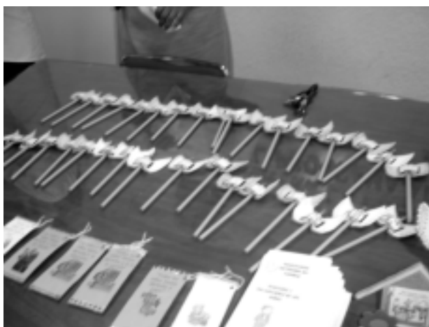
El material didáctico es una excelente herramienta para completar el curso