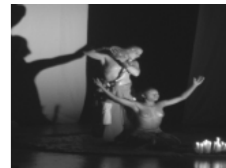
Teatro Avatar de Brasil, participó por segunda ocasión en este festival con la puesta en escena Kao