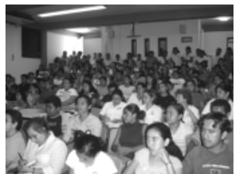
Concurrida fue la asistencia de los jóvenes a los Foros Preventivos