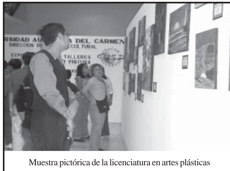
Muestra pictórica de la licenciatura en artes plásticas

Como tronco común de la DES: Introducción al derecho y Administración I.