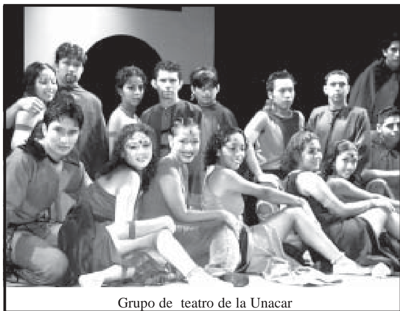
Grupo de teatro de la Unacar

La fecha de los exámenes son: Ceneval: tres de junio 2005, Collage Borrado: 11 de junio 2005 y Psicométrico: 18 de junio 2005, los resultados serán publicados el 14 de junio.