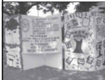
Mural representativo de la DES de Educación y Humanidades

En la explanada del CCU, se presentaron maquetas diseñadas por alumnos de los talleres de educación artística. Cabe mencionar el mural significativo donde, por medio de fotografías, representaban a todos los talleres que la Unacar imparte.