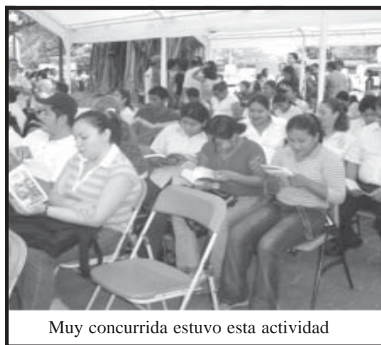
Muy concurrida estuvo esta actividad

Puntualizó que la palabra constituye del hombre el universo de su destino, la historia y la cultura.