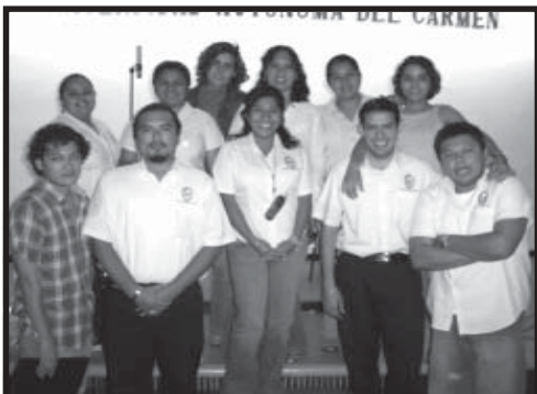
Personal de la Dirección de Difusión cultural en el Curso de Producción Radiofónica

El taller fue de enriquecimiento tanto en conocimientos como en práctica para los asistentes, dentro de los que destacan el personal de radio y televisión, difusión cultural, Centro Cultural Universitario y docentes que están interesados en participar nuestro espacio radial sabatino.