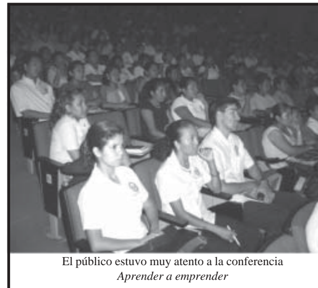
El público estuvo muy atento a la conferencia Aprender a emprender

Para concluir, externó el siguiente consejo: “Hay que luchar, nunca darse por vencido, no dormirse en los laureles; siempre hay algo por el cual luchar, por el cual vivir; hay que armar la lucha y nunca la caída”.