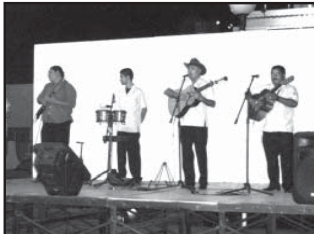
El trío Los Románticos, durante su presentación en la explanada del Centro Cultural Universitario.