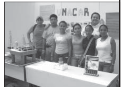
Entusiasta fue la participación de los alumnos de la Facultad de Química