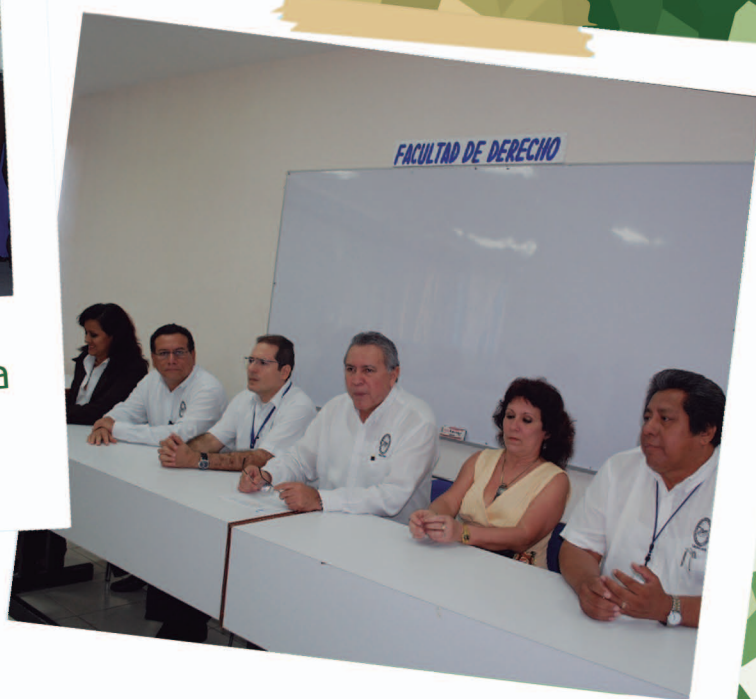
Obtiene acreditación licenciatura en derecho