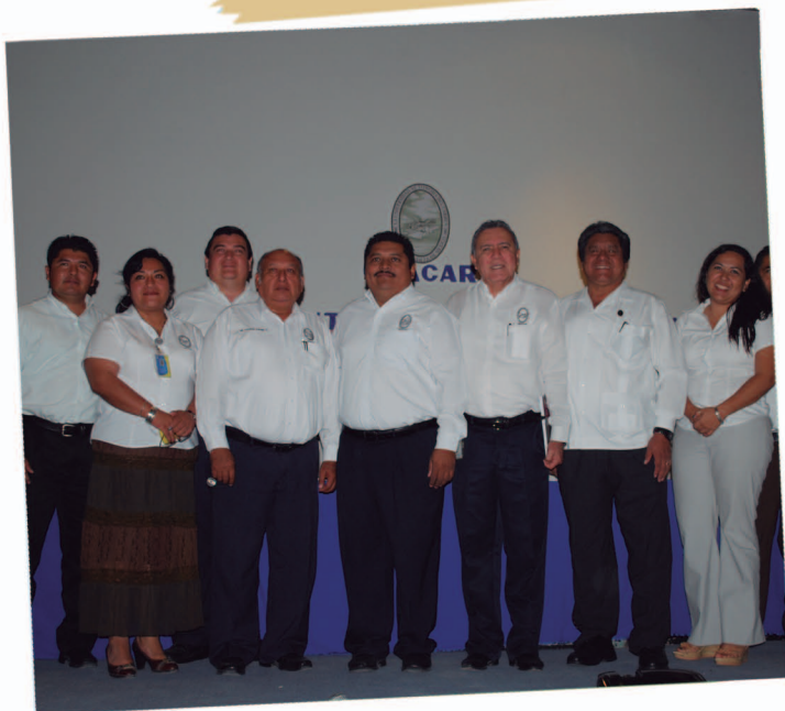
Programa educativo de ingeniería civil acreditado por COPAES