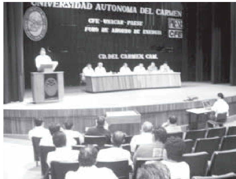
Intervención del superintendente de la Zona Carmen de CFE.