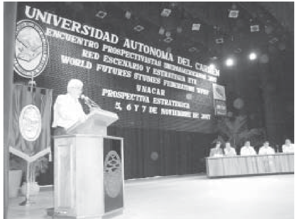
UNACAR, sede de este importante evento internacional.

Fueron tres días de intensa actividad. Se desarrolló a través de tres talleres de trabajo para públicos bien definidos y de conferencias magistrales a cargo de expertos prospectivistas invitados, que abordaron temas concretos del portafolio de estudios del futuro, relacionados con la toma de decisiones, las políticas a largo plazo, los procesos para influir, la educación de calidad, la innovación tecnológica y la empresa innovadora que le da valor agregado a sus procesos.