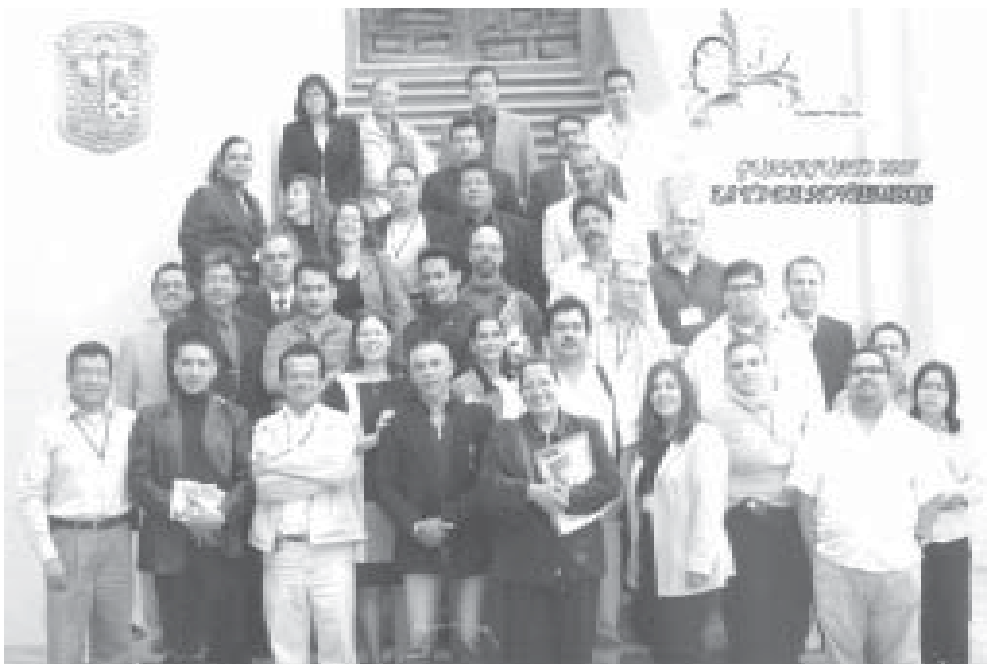
38 radiodifusoras y 14 productoras conforman el SINPRIES.

Del 7 al 9 de noviembre se llevó a cabo en las instalaciones del auditorio Euquerio Guerrero , de la Universidad de Guanajuato, la segunda Reunión Extraordinaria del Sistema Nacional de Productoras y Radiodifusoras de las Instituciones de Educación Superior, el SINPRIES.