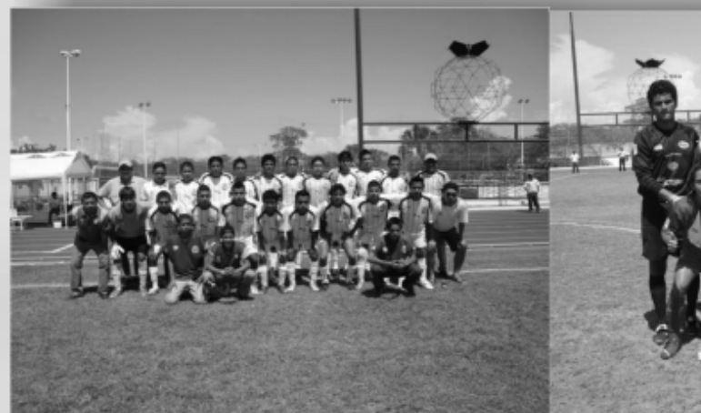
Delfines de la UNAGAR inician con un triunfo sobre el Real Victoria Carmen; Corsarios rescatan