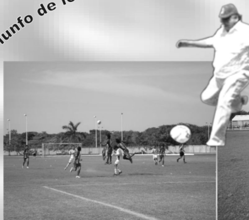
Triunfo de los Delfines de la UNAGAR