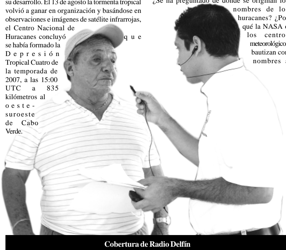
Cobertura de Radio Delfín

Asimismo, anunció que la tarifa para el alumnado no tendrá incremento: tres pesos, siempre y cuando cuenten y presenten la credencial de estudiante.