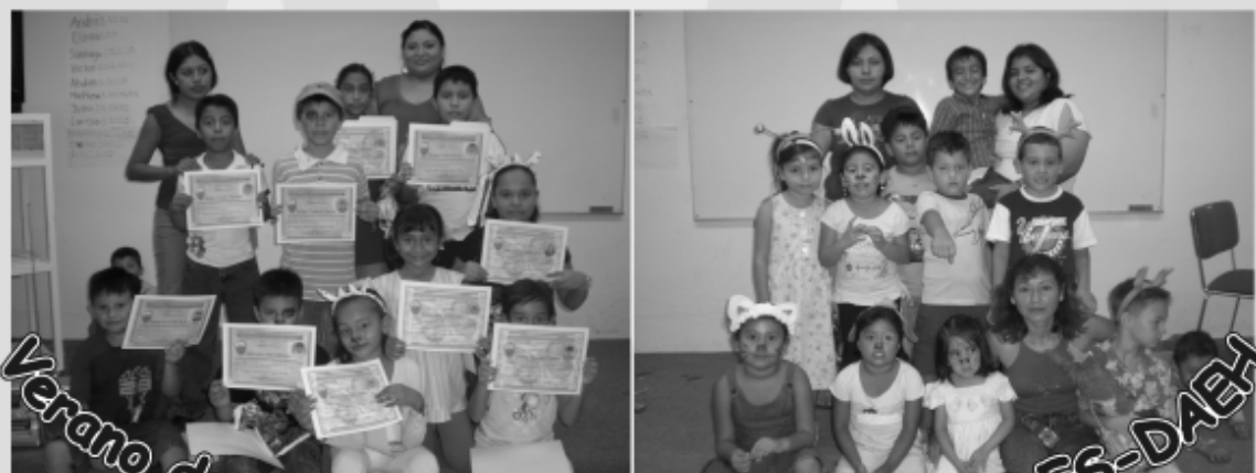
Verano de inglés para niños ofreció la DES-DAEH

1200 alumnos participaron en el Programa de Producción