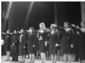
Toma de protesta alumnos de contaduría.