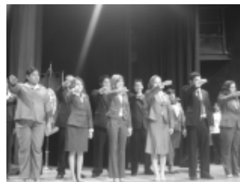
Toma de protesta alumnos de administración.