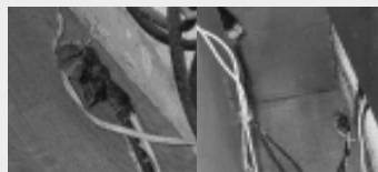
Aislamientos corroídos Empalmes mal aislados

Empalme correcto está hecha bajo norma, utilizando regletas de conexión.