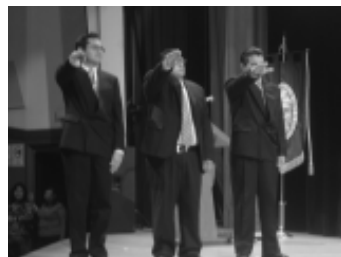
Toma de protesta alumnos negocios internacionales.