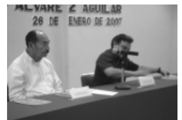
Autor y presentador en la mesa del presidium.