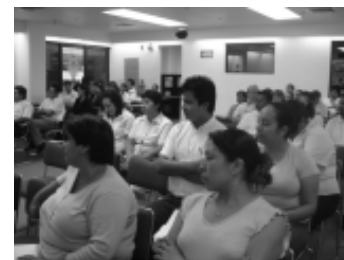
Docentes de todas las dependencias.