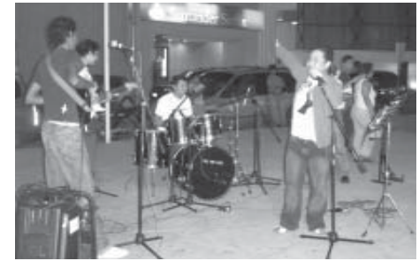
Grupo de rock Sinter , en Acercarte.

El día 10 de febrero se presentó la Rondalla Universitaria con un amplio repertorio de música romántica y boleros; un grupo compuesto por jóvenes talentosos que interpretaron temas de grandes autores, como Juan Gabriel, Armando