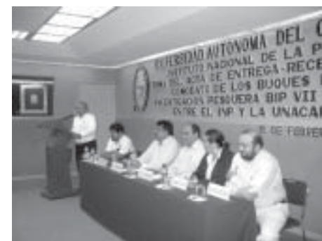
Vista panorámica del H. Presidium durante la ceremonia oficial de entrega de dos embarcaciones pesqueras a la Unacar.