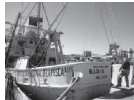
Barco BIP X, dado en comodato a la Unacar, por el Instituto Nacional de Pesca

Al evento asistieron varios empresarios navieros, quienes mostraron interés por participar en esta actividad.