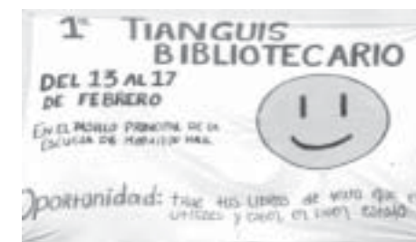
Cartel informativo estuvo colocado en las afueras de la Preparatoria.

En el tianguis bibliográfico apreciamos libros didácticos de matemáticas, física, química, metodología de la investigación, entre otros; asimismo, novelas, poe-