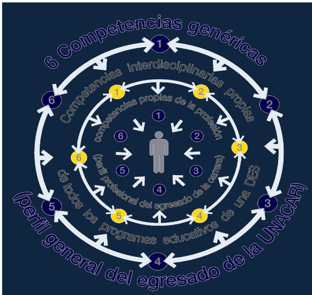
Figura 1. Los tipos de Competencia y su interrelación.

En la figura se observa la interrelación que guardan las competencias a desarrollar en los estudiantes a través del diseño curricular, aprobado en mayo de 2009.